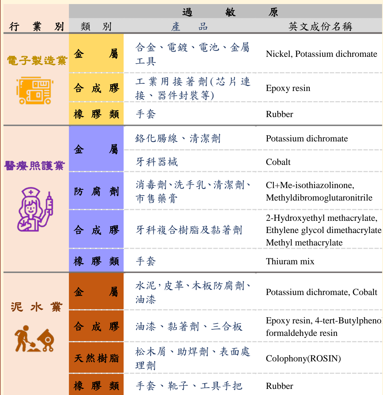
表2.高風險行業常見過敏原及相關產品對照表(續)