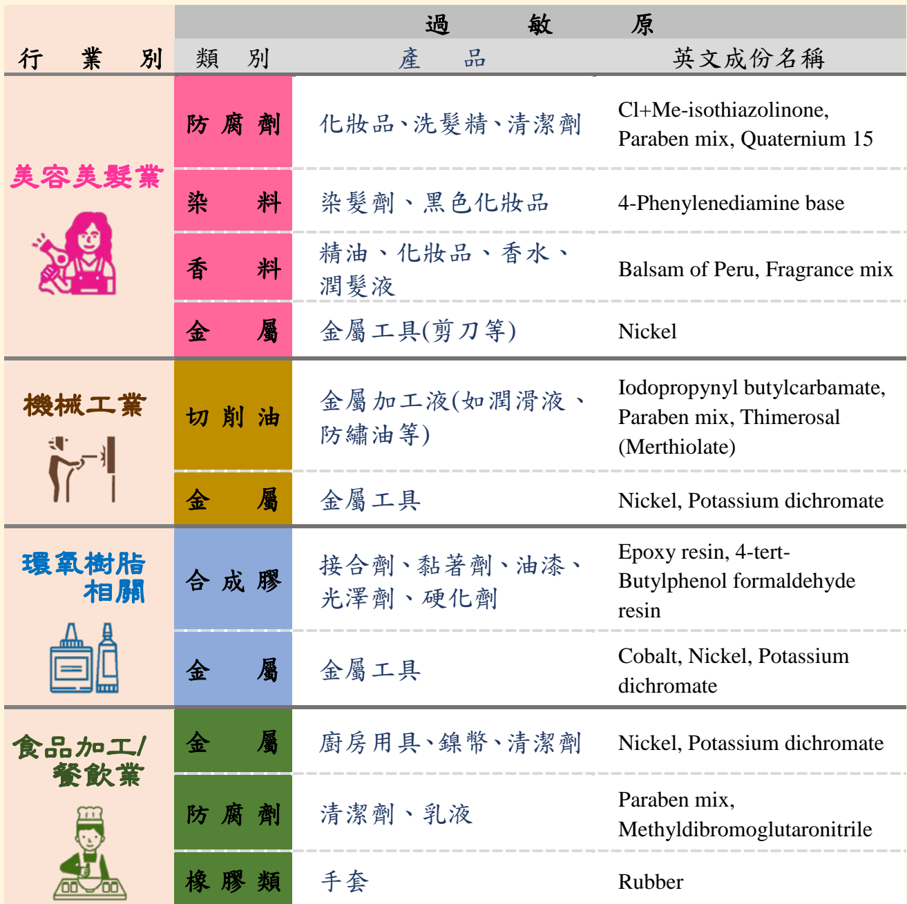
表2.高風險行業常見過敏原及相關產品對照表

以美髮工作者為例，如果出現手部不適症狀，建議可以觀察是否在接觸化妝品、洗髮精、清潔劑、染髮劑、精油、化妝品、香水、潤髮液、或金屬工具後，症狀出現或惡化？如果前述結果是肯定的，建議可到職業醫學門診，尋求進一步的診斷與治療。